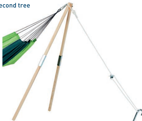
Madera Art.N°: AZ-4030100 without hammock