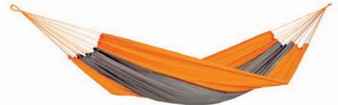
Silk Traveller techno Art.Nº: AZ-1030160