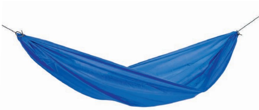
Travel Set blue Art.Nº: AZ-1030250