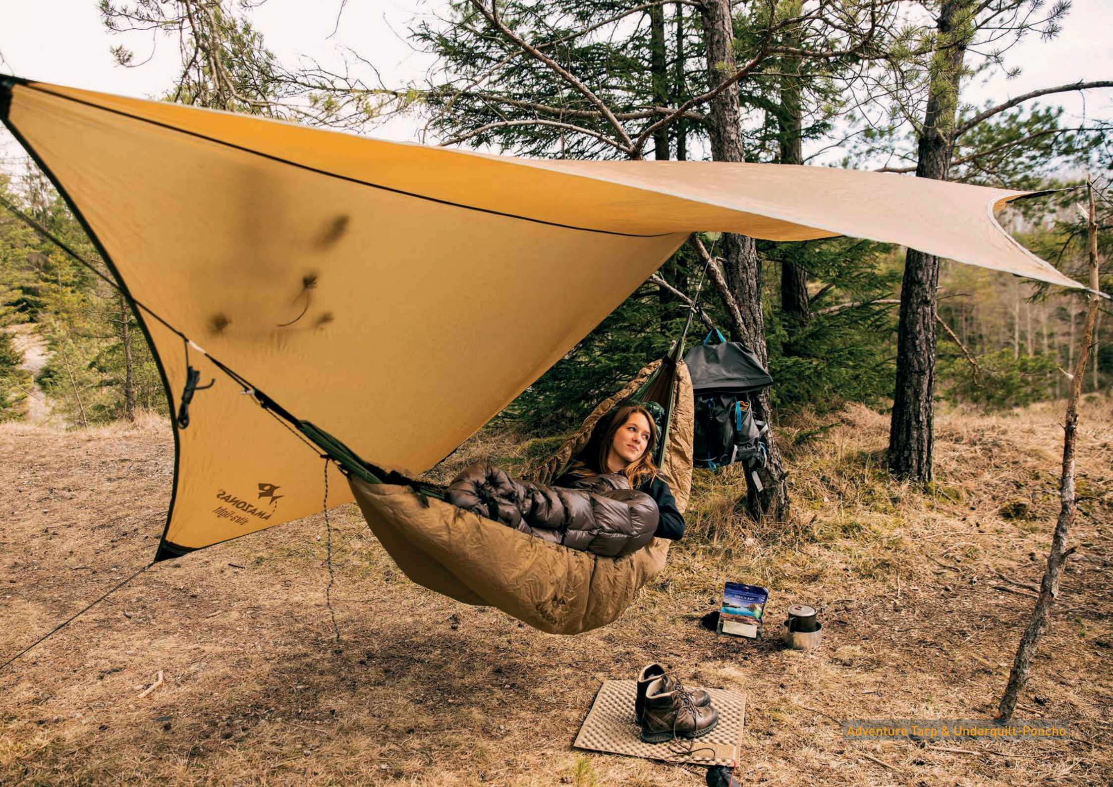
Adventure Tarp & Underquilt-Poncho