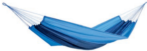
Silk Traveller ocean Art.Nº: AZ-1030180