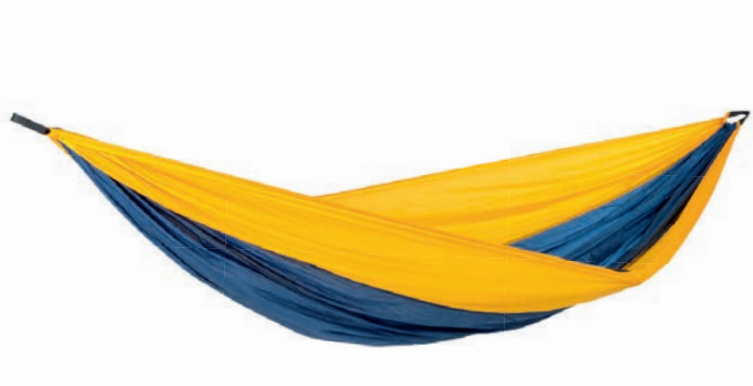
Adventure Hammock XXL nemo Art.Nº: AZ-1030420