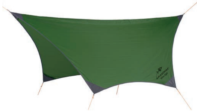
Traveller Tarp Art.Nº: AZ-3080010