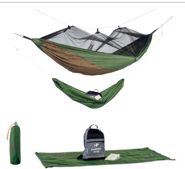
Hammock Floor Art.N°: AZ-3080011 hammock/daypack not included