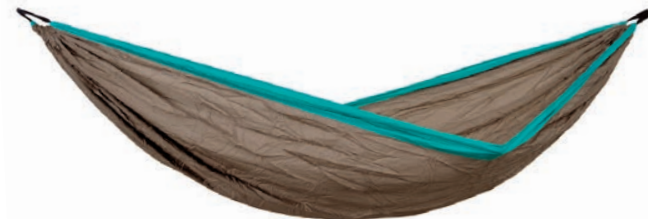
Silk Traveller XL mountain Art.Nº: AZ-1030186