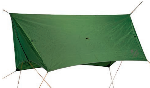
Wing Tarp Art.Nº: AZ-3080021