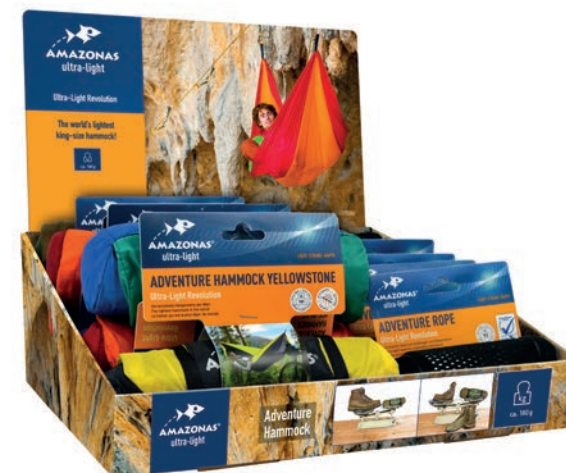
Adventure Box Art.N°: AZ-3890419 Contains 8 Adventure Hammocks & 8 Adventure Ropes