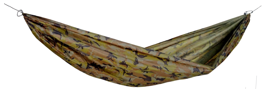
Travel Set camouflage Art.Nº: AZ-1030260