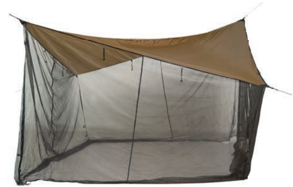
Moskito Tarp Art.Nº: AZ-3080020