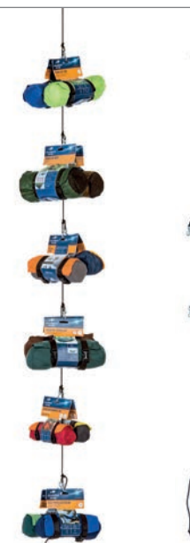
Rope Display Art.N°: AZ-3890418 without hammocks