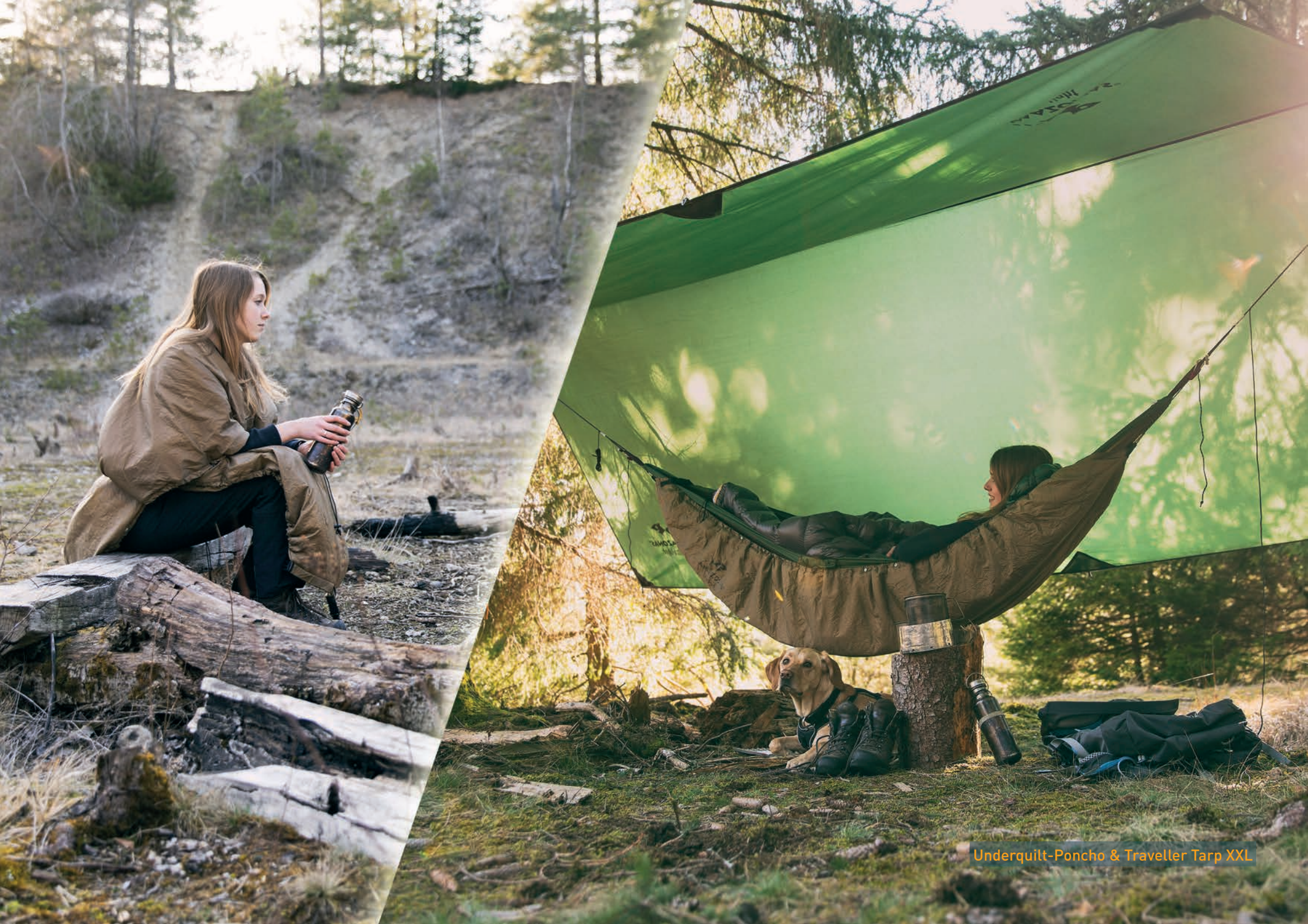
Underquilt-Poncho & Traveller Tarp XXL