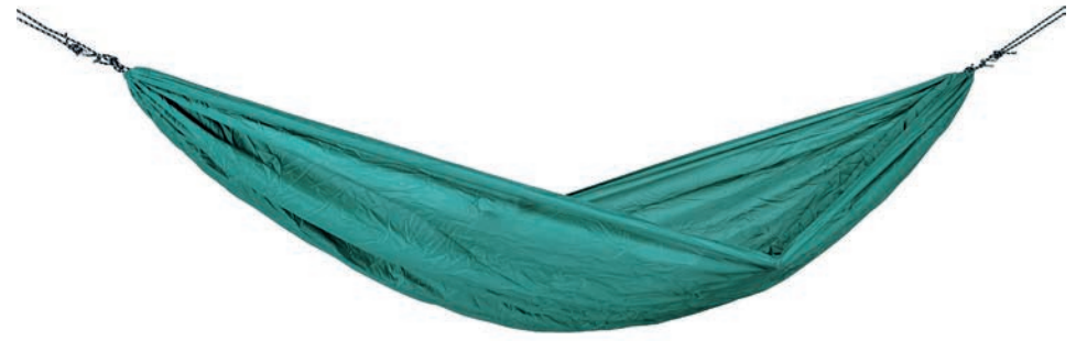
Travel Set jungle Art.Nº: AZ-1030265