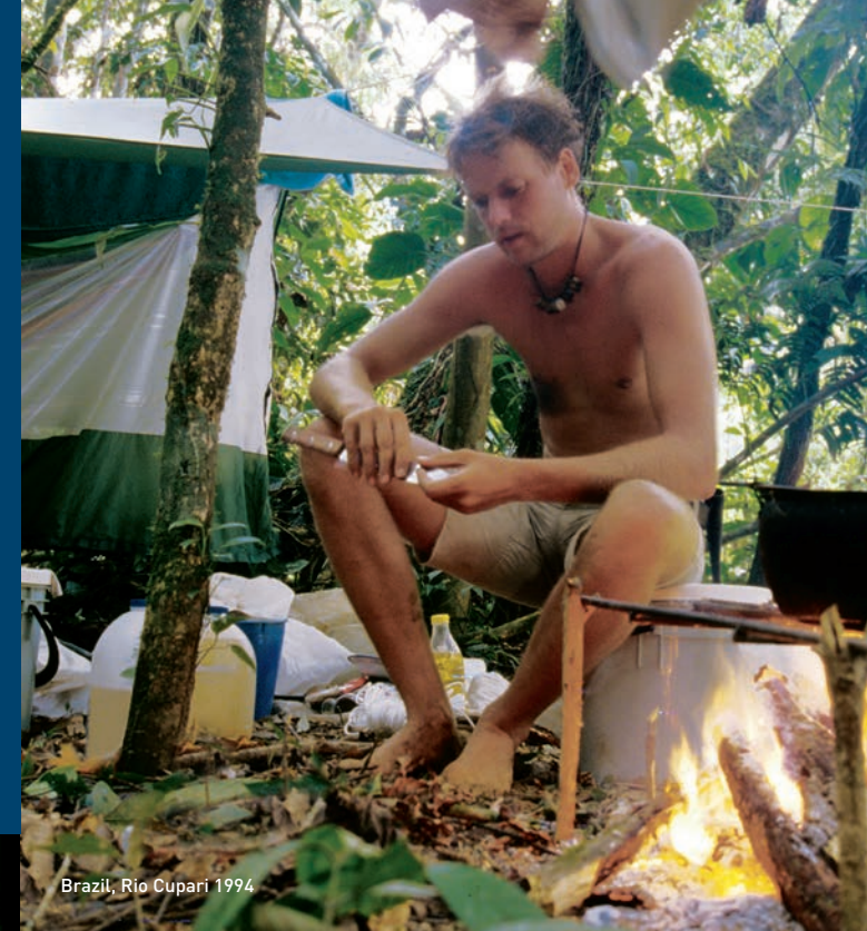
Brazil, Rio Cupari 1994