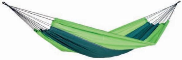
Silk Traveller forest Art.Nº: AZ-1030170