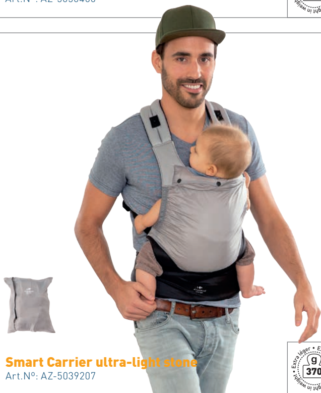
Smart Carrier ultra-light stone Art.N°: AZ-5039207