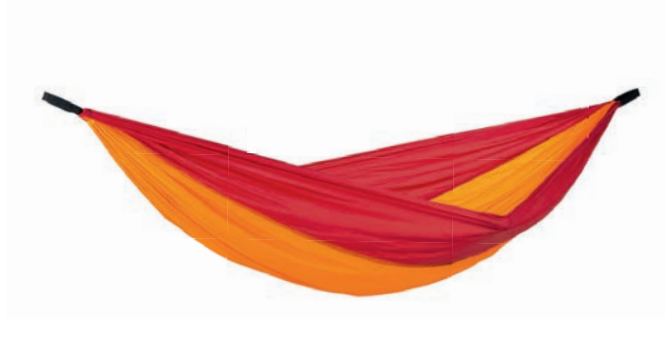
Adventure Hammock fire Art.Nº: AZ-1030412