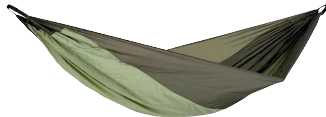
Silk Traveller Thermo Art.Nº: AZ-1030185