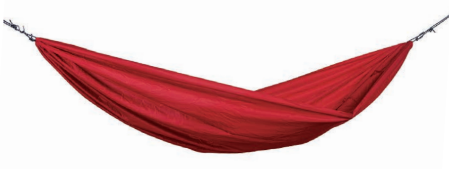
Travel Set mars Art.Nº: AZ-1030255