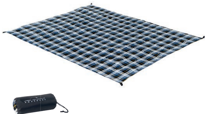
Travel Blanket ultra-light Art.N°: AZ-5050400