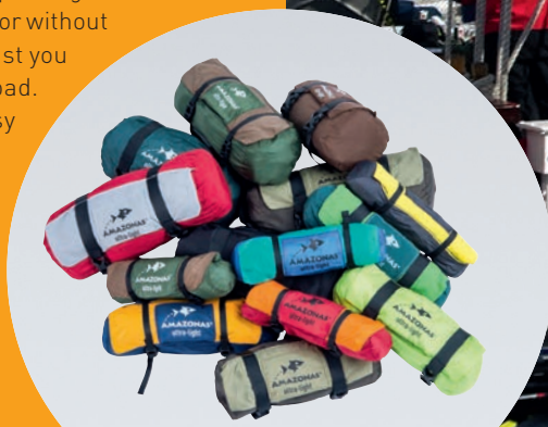
ultra-light • ultra-small