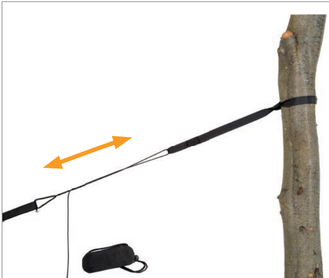
Adventure Rope Art.N°: AZ-3025003