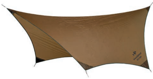
Adventure Tarp Art.Nº: AZ-3080015