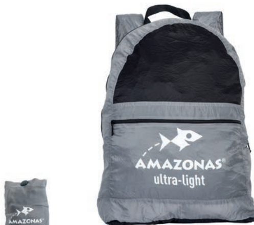
Adventure Daypack stone Art.N°: AZ-3080500