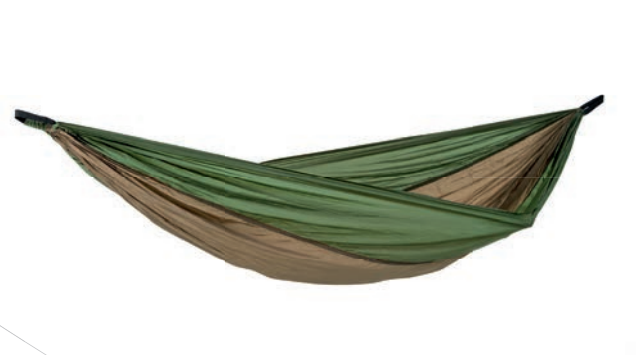
Adventure Hammock coyote Art.Nº: AZ-1030411