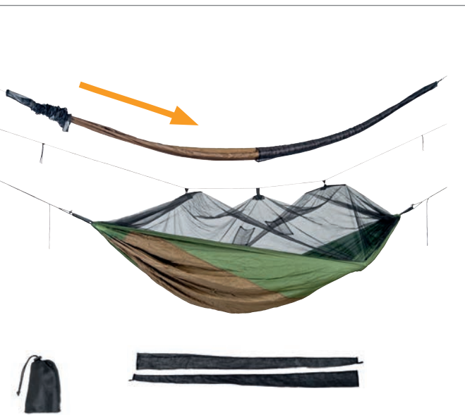
Tarp Sock Art.N°: AZ-3080025 hammock/tarp not included