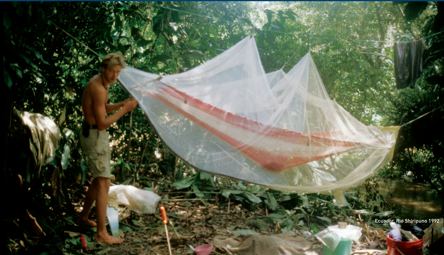
Ecuador, Rio Shiripuno 1992