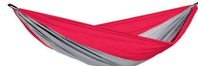
Silk Traveller XXL Art.Nº: AZ-1030190