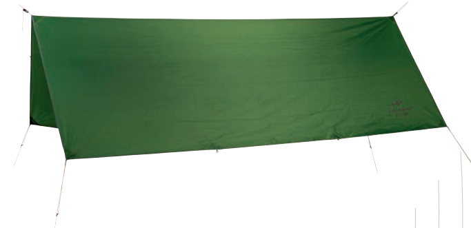
Traveller Tarp XXL Art.Nº: AZ-3080013