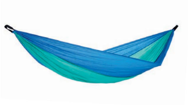
Adventure Hammock ice-blue Art.Nº: AZ-1030410