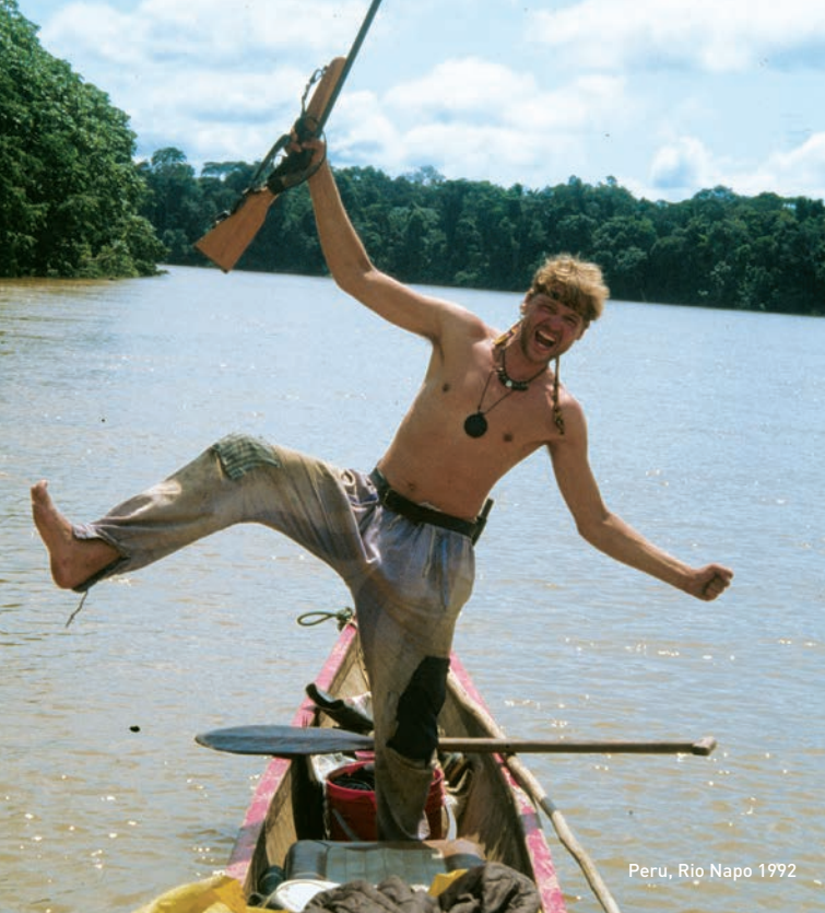
Peru, Rio Napo 1992