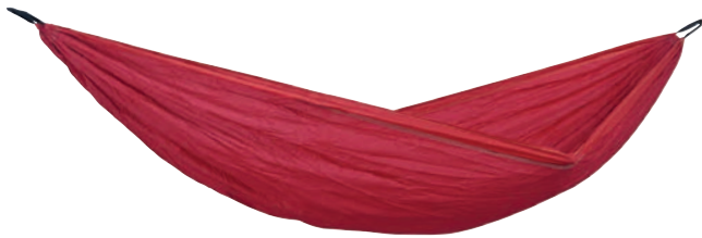
Silk Traveller XL chili Art.Nº: AZ-1030187