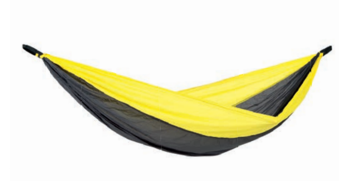
Adventure Hammock yellowstone Art.Nº: AZ-1030413