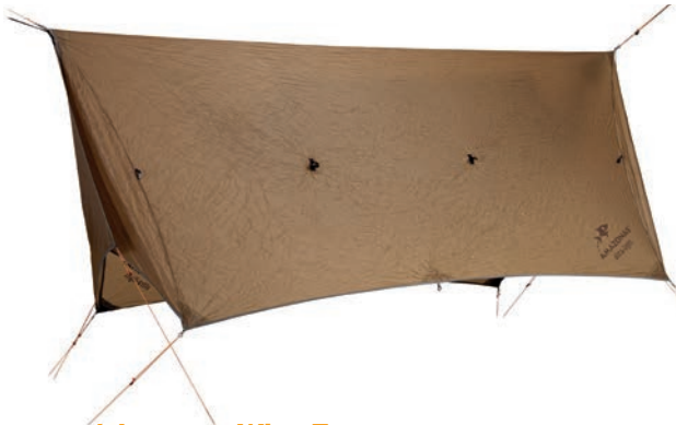
Adventure Wing Tarp Art.Nº: AZ-3080016