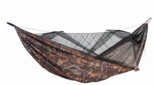
Moskito-Traveller Forest Art.N°: AZ-1030218