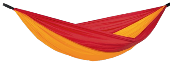
Adventure Hammock fire Art.N°: AZ-1030412