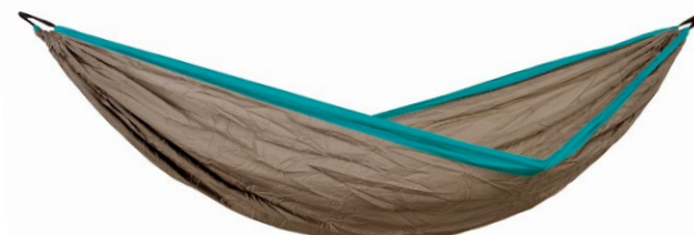
Silk Traveller XL mountain