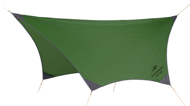
Traveller Tarp Art.N°: AZ-3080010