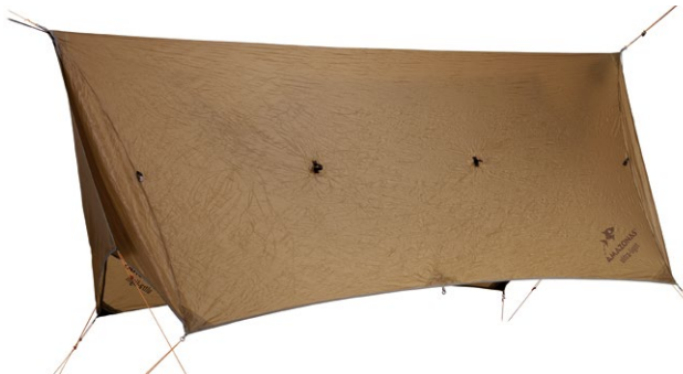
Adventure Wing Tarp Art.N°: AZ-3080016