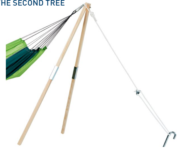
Madera Art.N°: AZ-4030100 without hammock