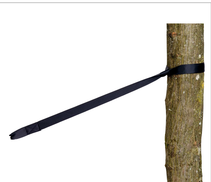
Tree Hugger Art.N°: AZ-3025004