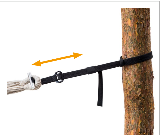
T-Strap Art.N°: AZ-3025002