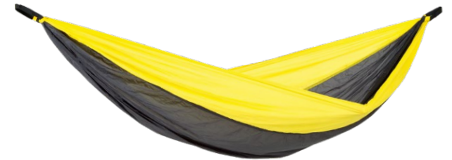
Adventure Hammock yellowstone Art.N°: AZ-1030413