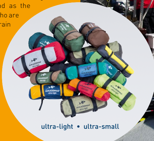
ultra-light • ultra-small