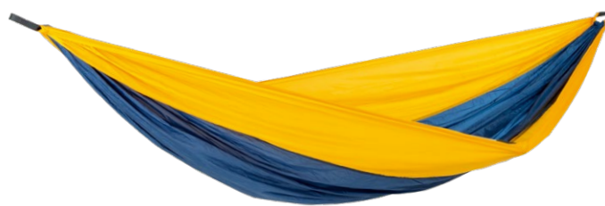
Adventure Hammock XXL nemo Art.N°: AZ-1030420