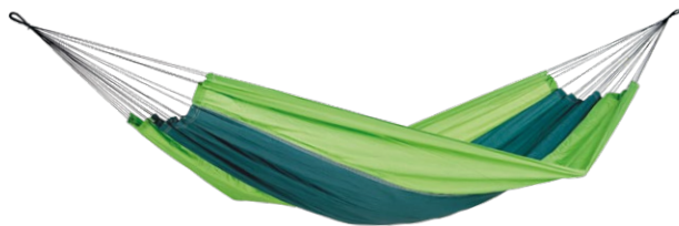
Silk Traveller forest