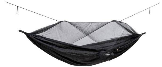
Moskito-Traveller Extreme Art.N°: AZ-1030220