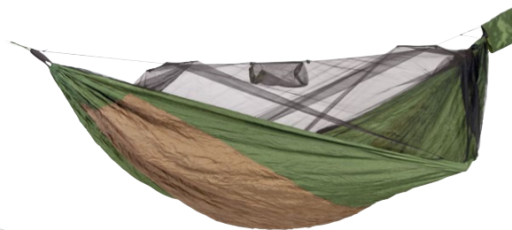
Adventure Hero XXL Art.N°: AZ-1030520