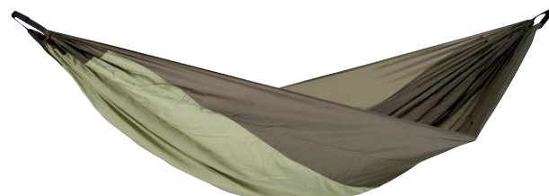
Silk Traveller Thermo