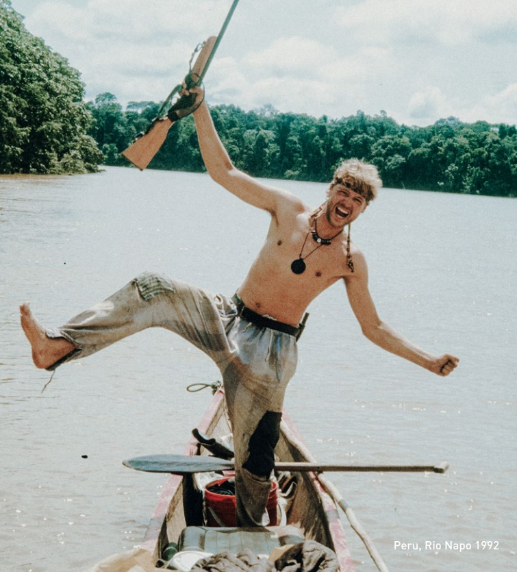
Peru, Rio Napo 1992