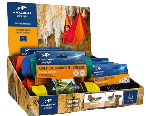
Adventure Box Art.N°: AZ-3890419 Contains 8 Adventure Hammocks & 8 Adventure Ropes