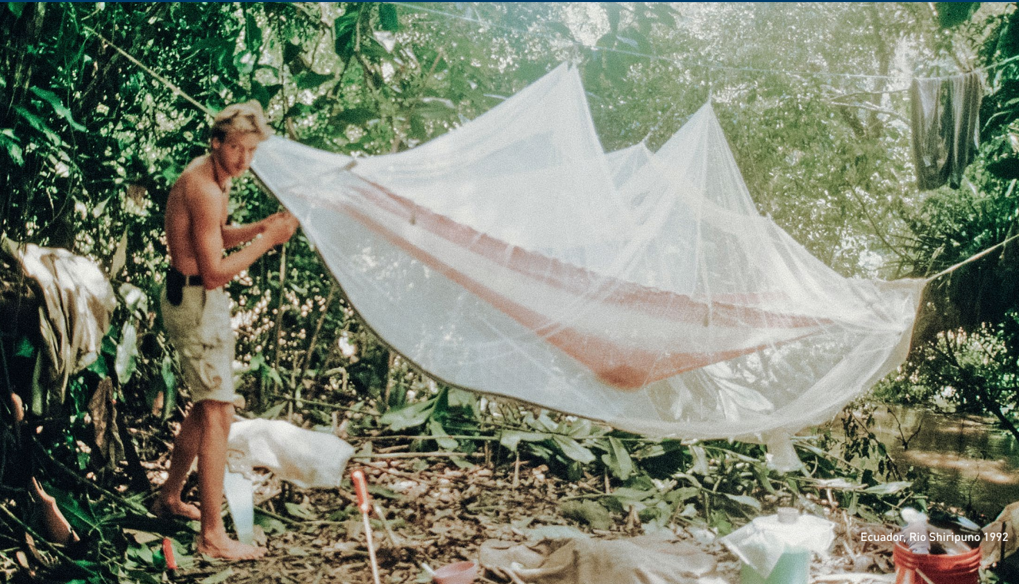
Ecuador, Rio Shiripuno 1992