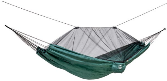
Moskito-Traveller Art.N°: AZ-1030200