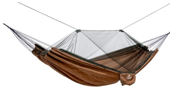
Moskito-Traveller Pro Art.N°: AZ-1030210