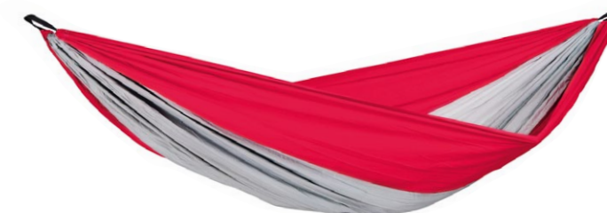
Silk Traveller XXL