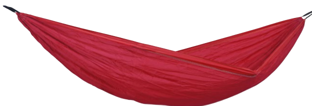
Silk Traveller XL chili