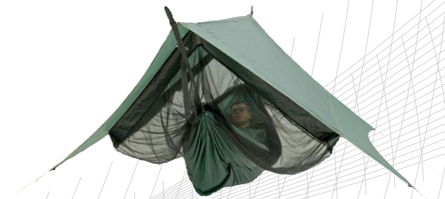
Traveller Camp Art.N°: AZ-3080017