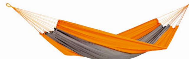
Silk Traveller techno