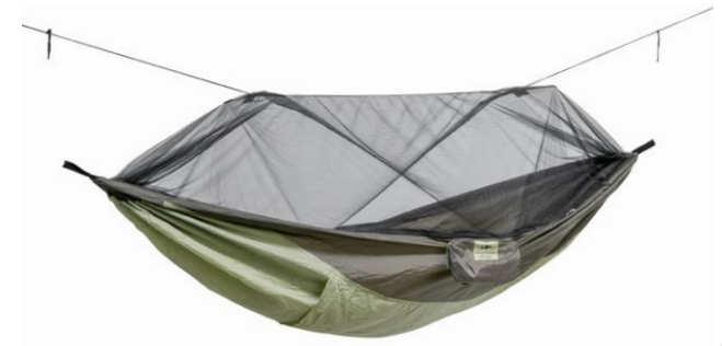
Moskito-Traveller Thermo Art.N°: AZ-1030230