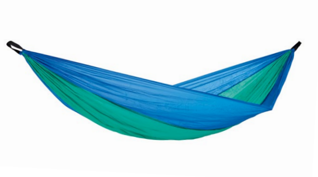
Adventure Hammock ice-blue Art.N°: AZ-1030410