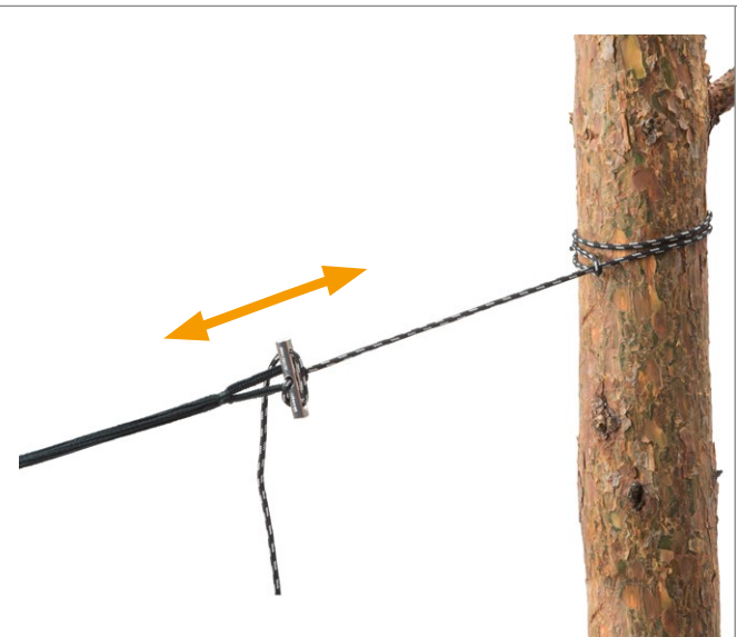
Microrope Art.N°: AZ-3027000