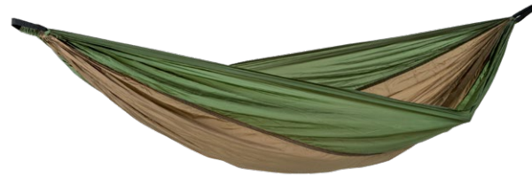
Adventure Hammock coyote Art.N°: AZ-1030411