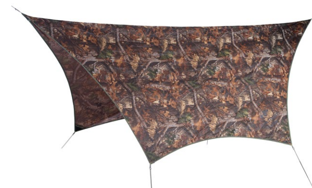
Traveller Tarp Forest Art.N°: AZ-3080008