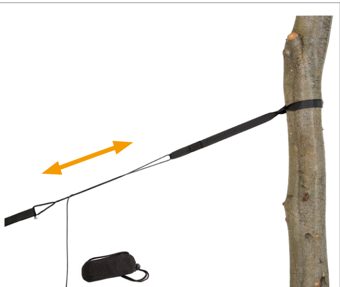
Adventure Rope Art.N°: AZ-3025003