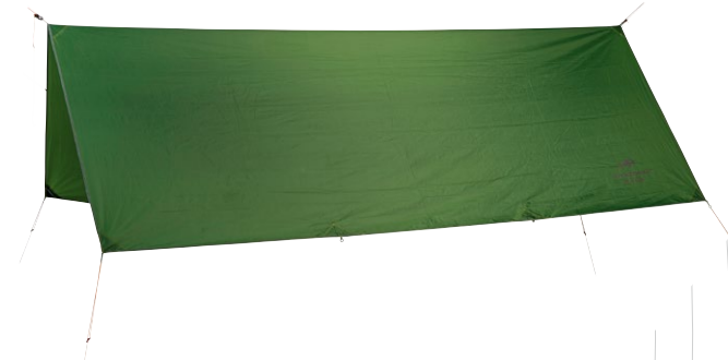
Traveller Tarp XXL Art.N°: AZ-3080013