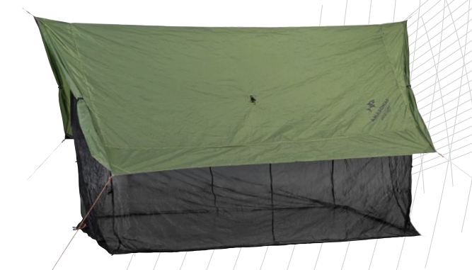
Moskito Wing Tarp Art.N°: AZ-3080030