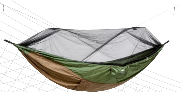
Adventure Moskito Hammock Thermo Art.N°: AZ-1030430