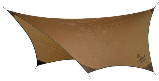
Adventure Tarp Art.N°: AZ-3080015