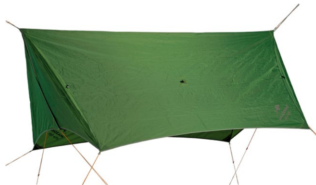
Wing Tarp Art.N°: AZ-3080021