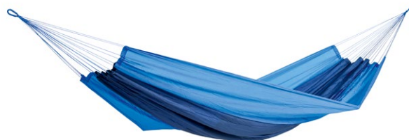
Silk Traveller ocean