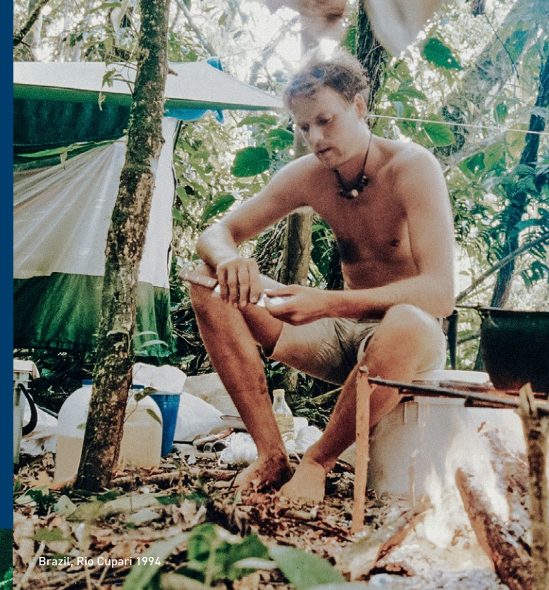
Brazil, Rio Cupari 1994