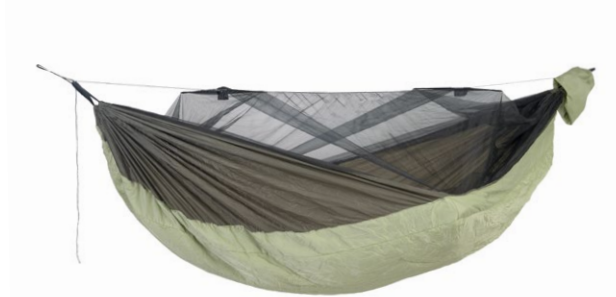
Moskito-Traveller Quilted Art.N°: AZ-1030240